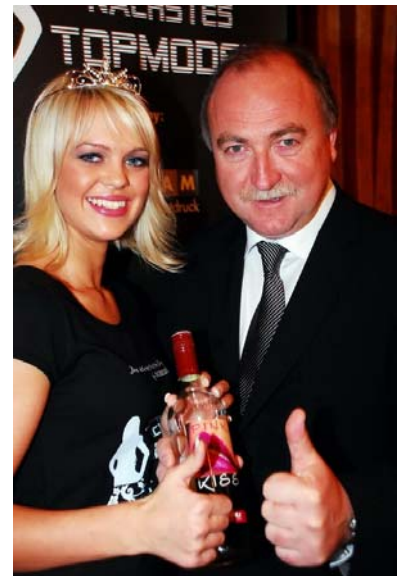
Foto by Klaus Müller, Abdruck mit Namensnennung und Bezug auf „Österreich's Nächstes Topmodel“ honorarfrei

Damit sicherte sie sich mit der Zweitplatzierten Grace Pamba, 26, (die erste farbige Finalistin von ÖNTM!) die Teilnahme am Großen Finale von „Österreichs Nächstes Topmodel“.